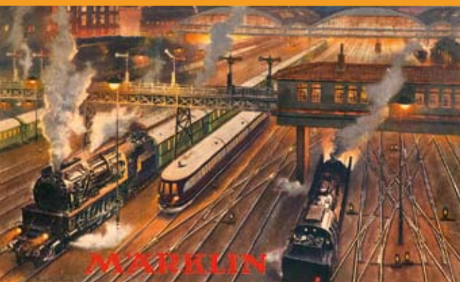
Bild auf Märlinkatalog, 1939