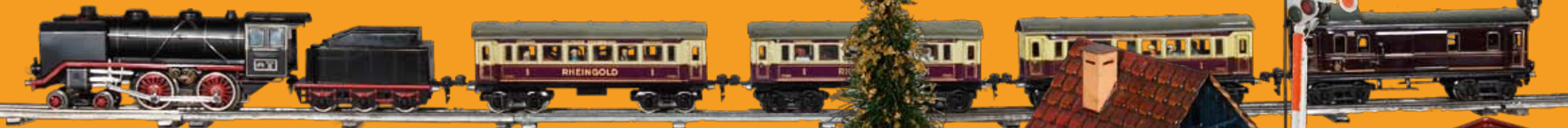
△ Der „Rheingold“, um 1938