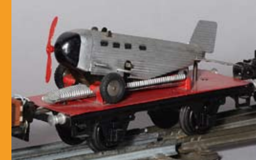
Plattformwagen mit Ju 52, 1935

Wie kleine faszinierende Träume aus Blech und Stahl, aufwändig und mit großer Präzision hergestellt, rollen die Lokomotiven und Wägen der vor etwas mehr als 100 Jahren erstmals hergestellten Spur 0 auf 32 Millimeter breiten Blechgleisen daher. Ursprünglich nur für die Kinder zum Spielen gedacht und während der Weihnachtszeit aufgebaut, sind die alten Spielzeug- und Modelleisenbahnen heute längst zu begehrten Sammlerobjekten geworden.