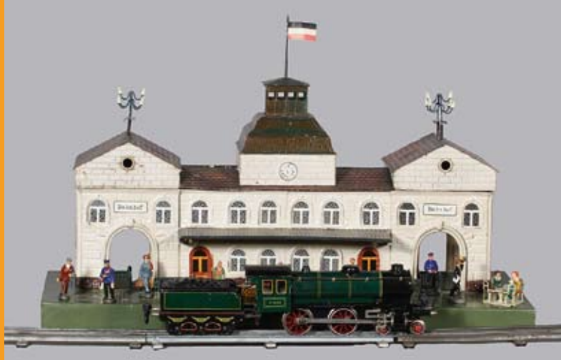
△ Bahnhof, 1920. Uhrwerkslokomotive, um 1930