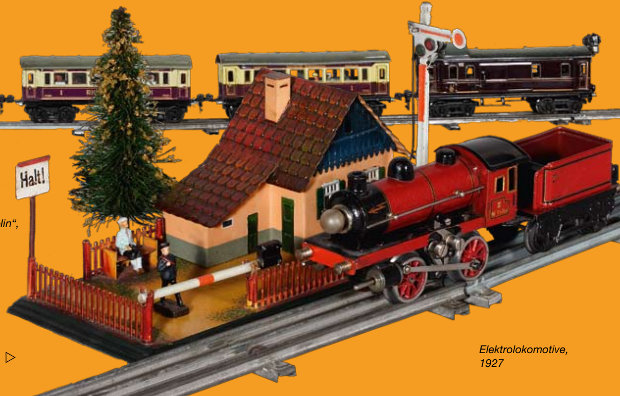
Wärterhaus mit Schranke, um 1925