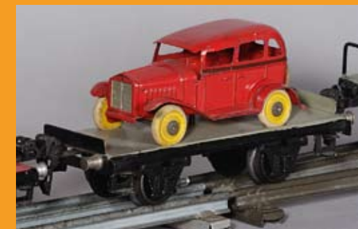
Plattformwagen mit Auto, 1932

Die Ausstellung zeigt die technische Entwicklung der heute relativ unbekanntem Spur 0, vom uhrwerk- oder dampfgetriebenen Spielzeug bis hin zur detailgetreu nachgebauten elektrischen Modelleisenbahn der 1930 und 40er Jahre, als sich Märklin dann jedoch auf die Produktion der kleineren Spur H0 zu konzentrieren begann. Der Zufall will es, dass die Ausstellung mit dem 150jährigen Jubiläum der Firma zusammentrifft.