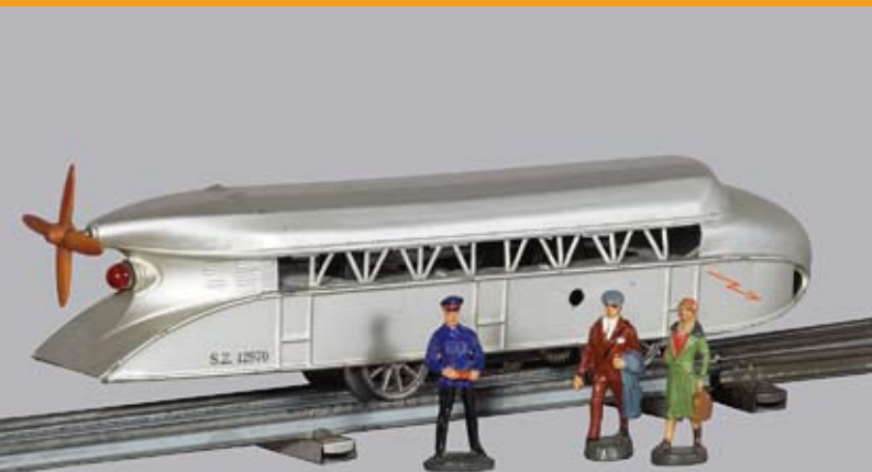
△ Der „Schienenzeppelin“, 1932